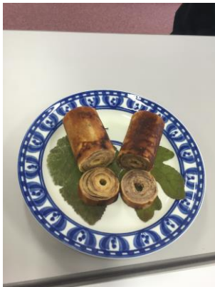
いちじくとくわの実のバウム