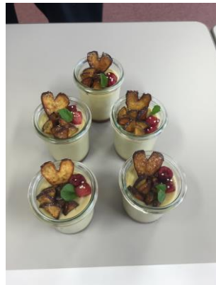
マーメイドプリン