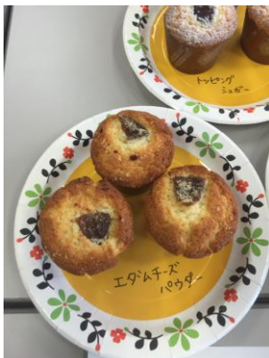
いちじくとクリームチーズのマフィン