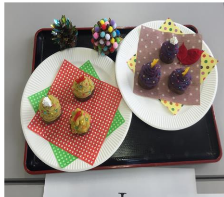
松まつりツリーに見たてた「イモンブラン」