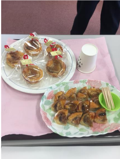
恋するうのんちゃんのいちじくタルト