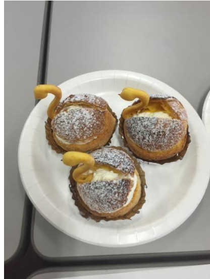
バナナかぼちゃのスワンシュー