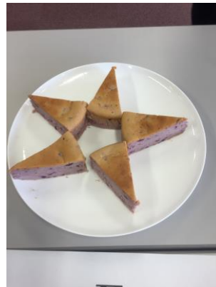
砂丘育ちのさつまいもフロマージュ