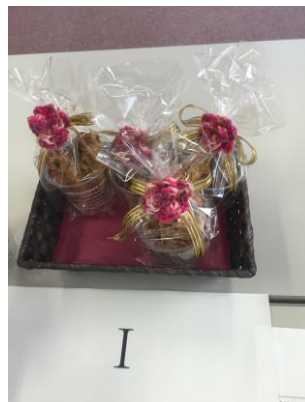
Beautiful sunset and Biscotti